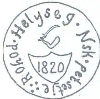
2. sz. ábra 1820-ból származó fém pénz

A község az 1860-as években közigazgatásilag a Nyírbátori felső, a XX. század elején a Nyírbátori, 1920-tól a Nyírbaktai, 1945-től a Baktalórántházi, 1971-től a Mátészalkai járáshoz tartozott. Jelenleg Mátészalka városkörnyékének része. Az 1920-as években a Nyírbaktai körjegyzőségben szerepelt. Az 1940-es évek közepétől Vaja nagyközséghez osztották be. 1970-től nagyközségi közös tanács társközsége, tanácsának székhelye Vaja, társ községe Őr volt, majd az 1980-as évektől Nyírparasznya is a társközsége lett.