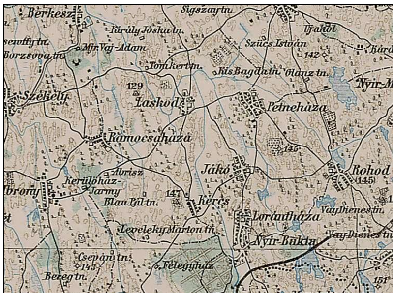
Monarchia katonai felmérés 1910 körül

Alapvető cél a település helyi kultúrájára jellemző sajátosságok kutatása azok feltárása, a helyi értékek számbavétele és rendszerezése és abból a helyi értékvédelmi javaslat elkészítése. A különböző építészeti megoldások vagy a tapasztalat vagy a társadalmi hovatartozás vagy praktikus megoldások egymásráépüléséből adódnak. Ezek a megoldások néha érvényüket veszítik, néha felerősödve rányomják bélyegüket az építészetre. A különböző korok keveredése, átfedése is hordoz magában olyan megoldásokat, melyben felfedezhetünk szépet, és megóvandót.