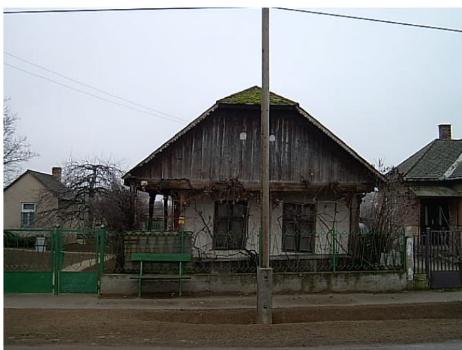
Rohod, lakóház Kossuth L. u. 26.