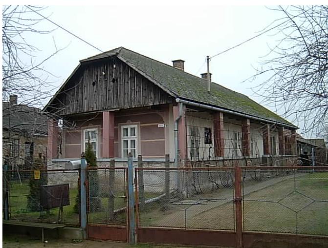
Rohod, lakóház Kossuth L. u. 55.