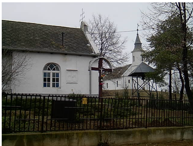
Rohod, Jókai u. imaház