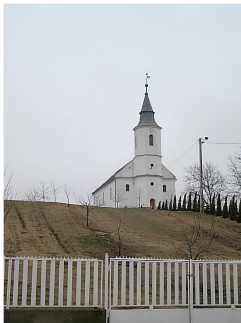
Rohod, Jókai u. Református templom