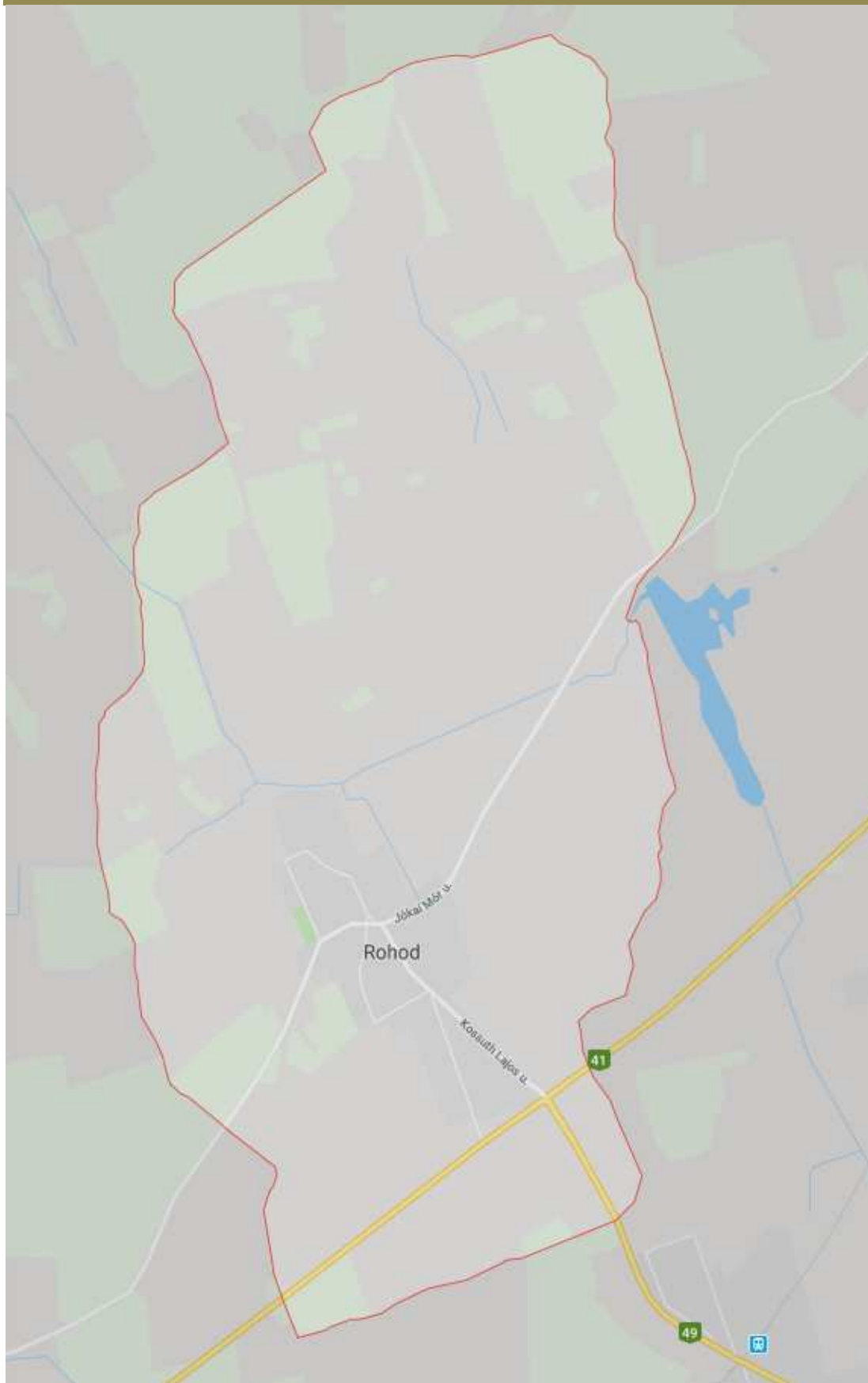
Átnézeti térkép teljes közigazgatási terület